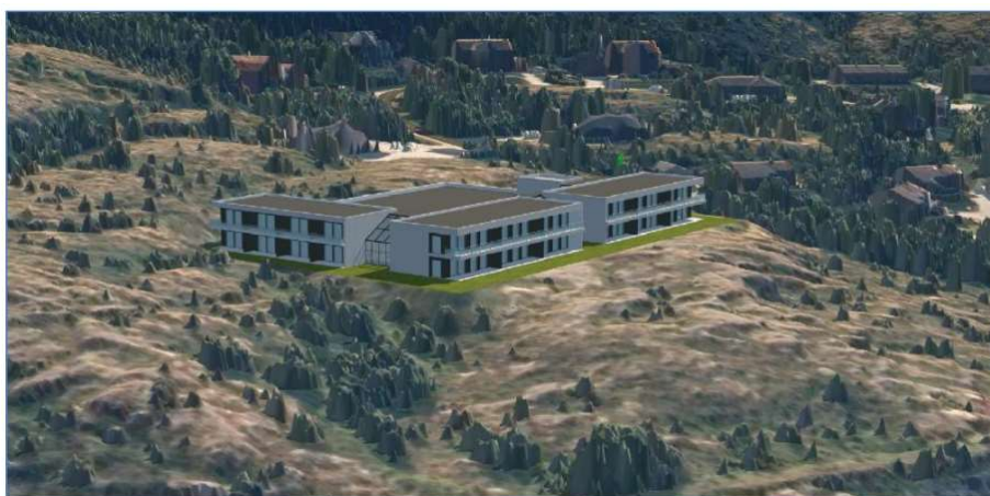
Figur 5 3D-visualisering av mulig leilighetsbebyggelse

Det er for øvrig også andre bestemmelser vi stusser ved ifm dette varselet.