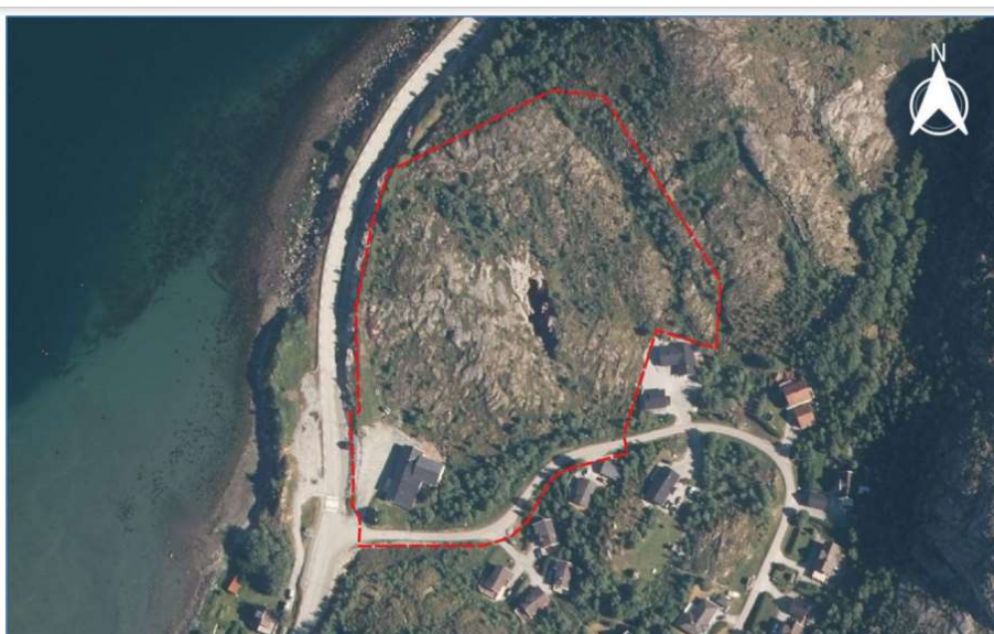
Figur 3 Flyfoto med foreslått planavgrensning (stiplet rød strek), M = 1:3 000.

Tilstøtende boligfelt i Bjørgan ble etablert etter beiteaktiviteten hadde opphørt, og området oppleves nok i dag mer tilvokst enn da det ble brukt som beite. Det er mest oppslag av busker og trær i lavbrekkene/ landskapsdragene. Hovedsakelig er likevel de øvre nivåene relativt åpne, delvis med bart fjell