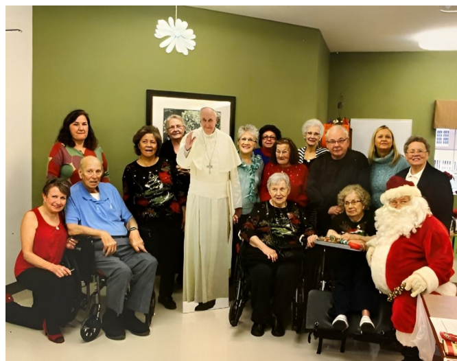
Członkowie SNR i członkowie rodzin na przyjęciu Bożonarodzeniowym z papieżem i św. Mikołajem w Domu Spokojnej Starości Breckville of Oaks.

Na 6 kwietnia 2024 r. zaplanowano jednodniowe popołudniowe rekolekcje dla członków SNR w Erie, w Pensylwanii. Ksiądz Larry Smith będzie przewodniczył sesjom zaplanowanym na ten dzień. Członkowie SNR będą mieli okazję skorzystać z sakramentu pojednania oraz wspólnej modlitwy różańcowej. Będzie też czas na osobistą refleksję i wspólny posiłek. Członkowie SNR będą mieli możliwość zakończenia dnia uczestnictwem w Eucharystii.