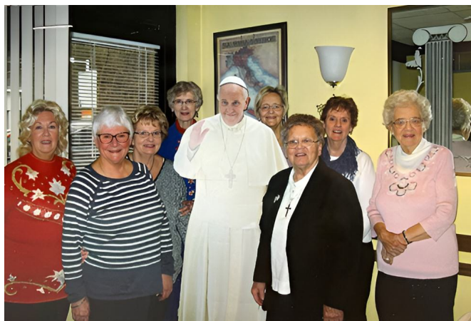
Członkowie SNR w Pittsburghu w Pensylwanii. „Jeśli nie możemy pojechać do Rzymu, aby zobaczyć się z papieżem – papież przyjechał do Pittsburgha – do nas”.