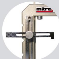
Brazo de ajuste