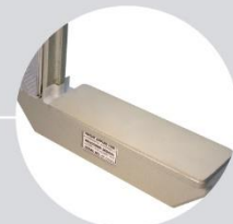
Base de Goma