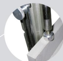
Husillo de Presión - copete