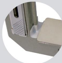
Ranura de recogida de cola