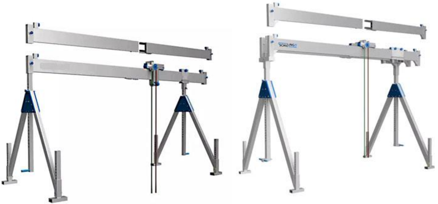
Detalle del ensamblado de las partes.

Introducción: Las vigas seccionables, comenzaron como una opción, pero han demostrado que son tan ventajosas que se han incorporado a la construcción estándar incorporando el código ( - 10 ) al número de referencia, para hacer el equipo más fácil de transportar en cualquier vehículo furgoneta y reducir el peso de las piezas en la fase de montaje / desmontaje.