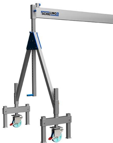
Detalle de ruedas para mover sin carga la grua