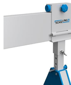
Detalle del ajustador de luz