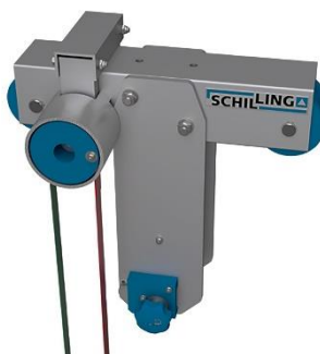
Detalle del Carro