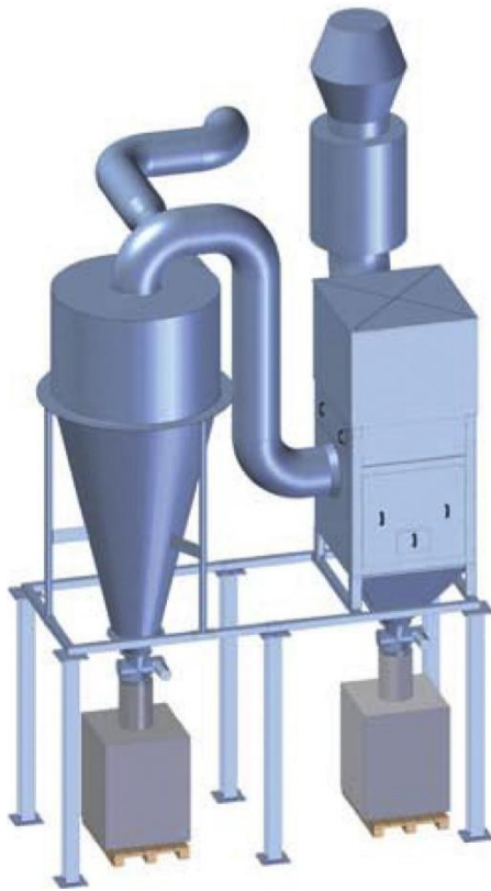
Separador ciclónico ZVA con IEP de Desempolvador y eliminación De Big-Bag.