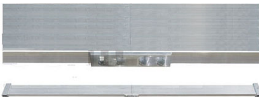
EMPALME DE VIGA

La viga plegable en dos tramos de 2.000 mm cada uno que pueden unirse o utilizarse de forma independiente tiene un sobre precio de