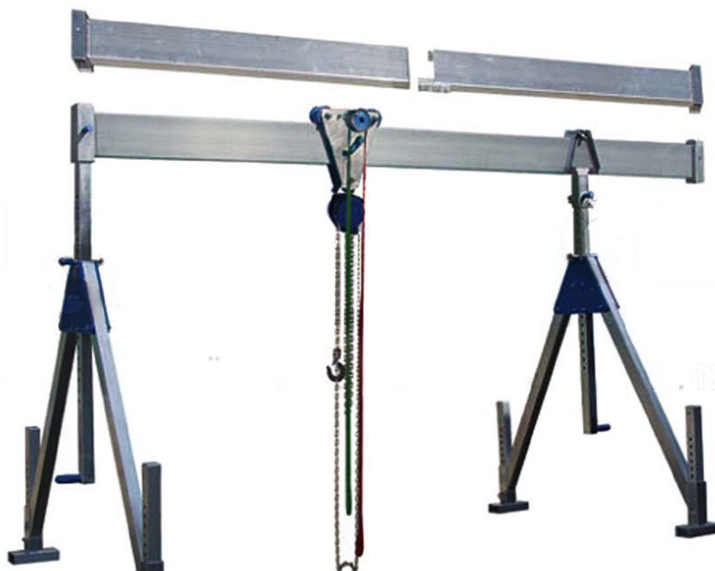
EMPALME DE VIGA FACILITA EL TRANSPORTE