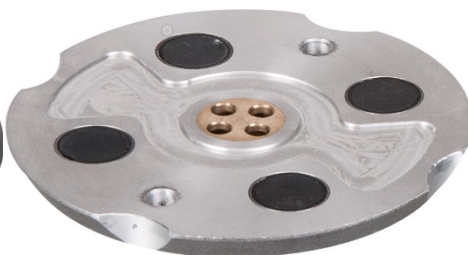
4 puntos magnéticos Distribuidor de agua