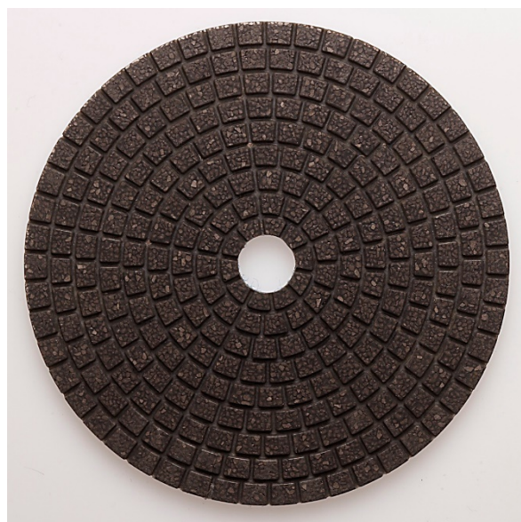
Disco / Lija Diacerámica velcro Metal Diamante Ø 100

Ver su aplicación en este enlace : https://youtu.be/fy2iXJSmUMM