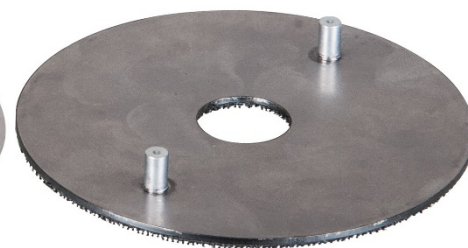
Plato Ejes guias y velcro