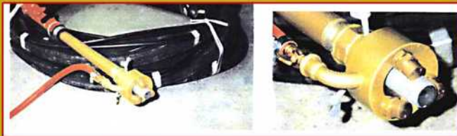
NEBULIZADOR DE AGUA

REHABILITACION DE FACHADAS HISTORICO ARTISTICAS CON CHORROS DE PRECISION "POWER SOFT" DE GOLDMANN - PARA SECO Y EN HUMEDO