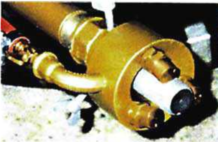
DETALLE DEL NEBULIZADOR DE AGUA ACOPLABLE A TODO TIPO DE CHORROS