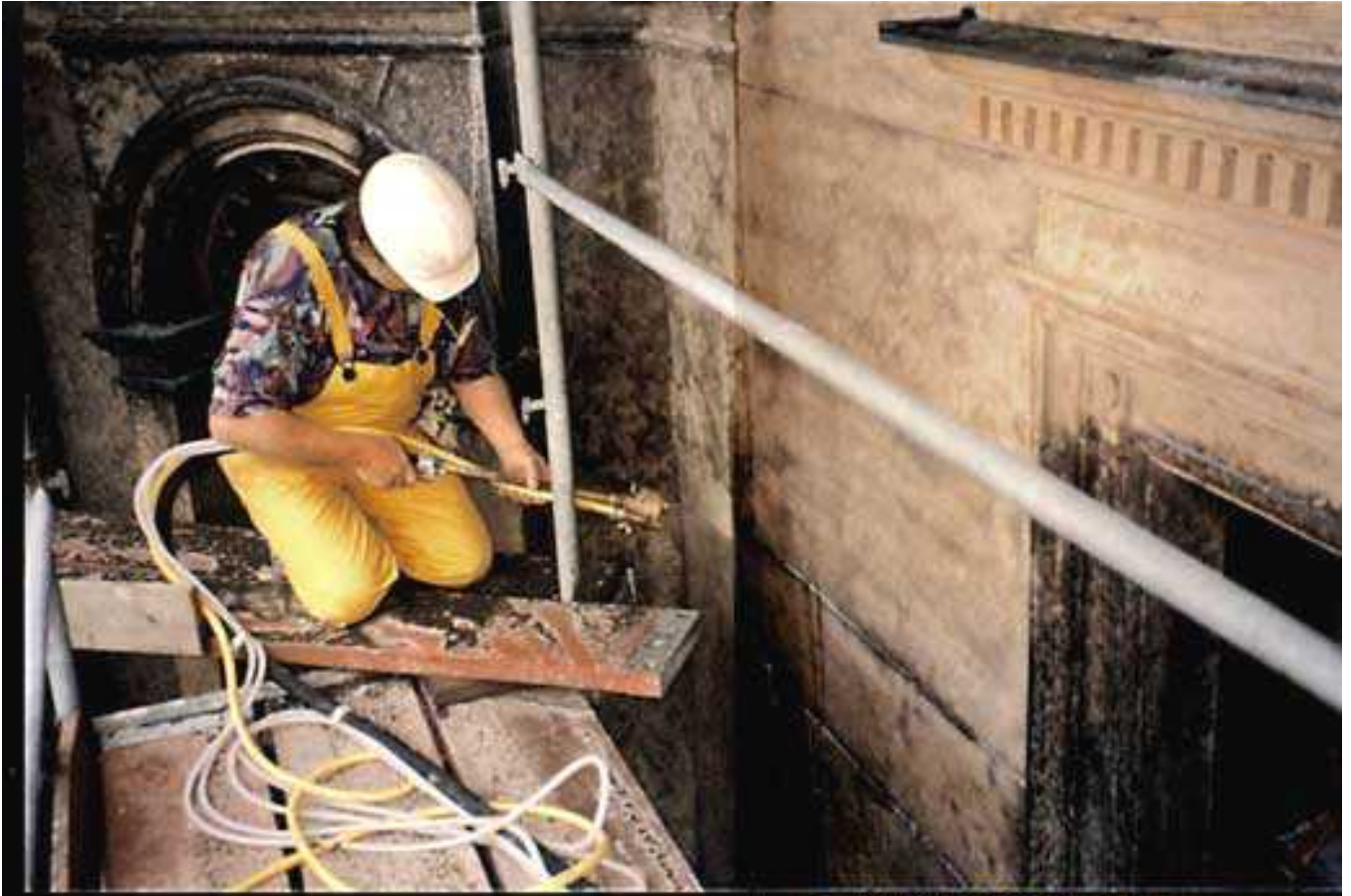
LIMPIEZA DE FACHADAS Y MONUMENTOS CON CHORRO DE ABRASIVO EN HUMEDO