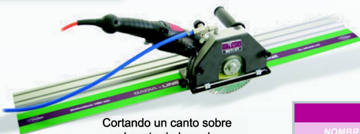
Cortando un canto sobre el canto de la regla