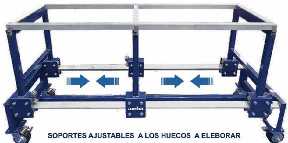
SOPORTES AJUSTABLES A LOS HUECOS A ELEBORAR