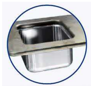
Facil trabajo en Huecos