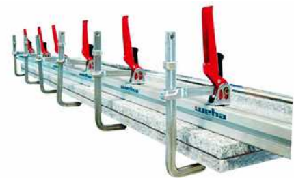
Pegado para doblar espesores