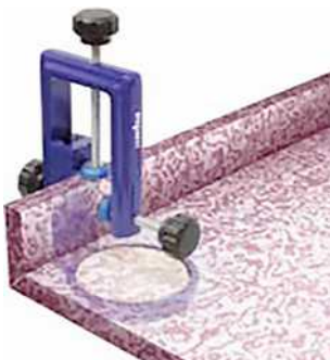
Gato para ingletes