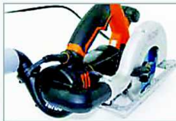
Sistema patentado y exclusivo de extracción de polvo