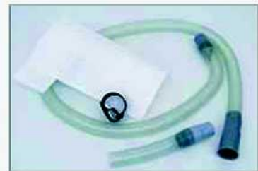
Accesorios incluidos: Bolsa filtro, Tubería, pulsera fijación de velcro