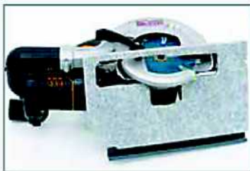
Recubrimiento de fieltro en la base para prevenir arañazos de la superficie

cortes a 90° y 45° son posibles para baldosas de hasta 2 cm.