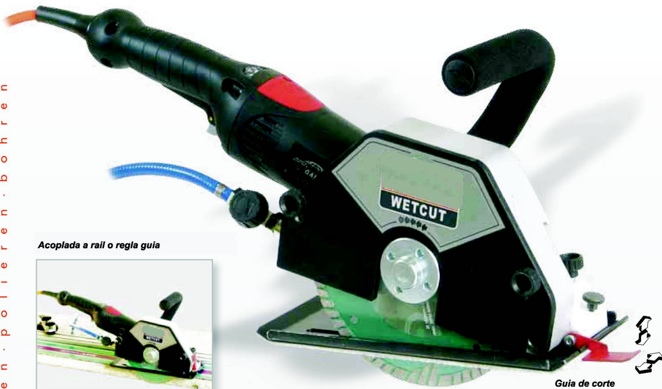
Acoplada a rail o regla guía