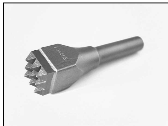
EJE N° 14 Corto