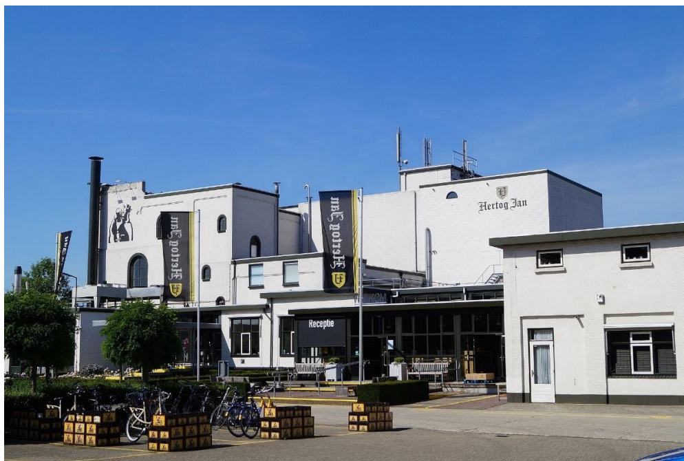
Hertog Jan brouwerij

Hertog Jan is vernoemd naar de 13e-eeuwse hertog Jan I van Brabant die, naar verluidt, van feesten hield waar het bier rijkelijk vloeide. Eventuele rondleiding moet van te voren via website worden gereserveerd en duurt 2 uur incl. proeverij! Kosten: € 13,95