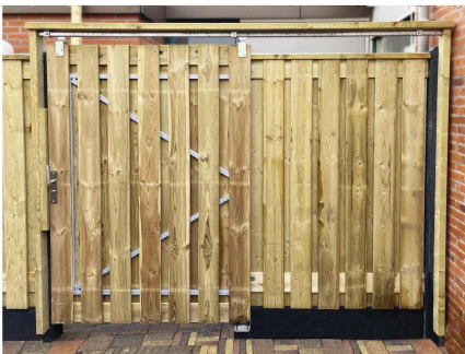
1. Porten åben