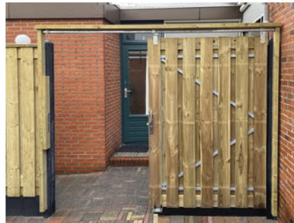
2. Porten lukket