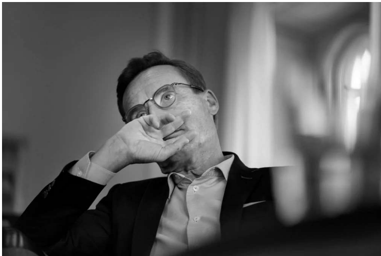
Ulf Kristersson riktade nyligen kritik mot regeringens hantering av coronapandemin.

– Vi satt i samtalen eftersom vi såg en möjlighet att göra det som jag pratat om sen den dagen jag valdes till partiledare. Stefan Löfven sa i januari att han kraftigt vill minska invandringen. Om S på allvar vill det som de säger sig vilja så vill vi tillsammans skapa en långsiktigt stram migrationspolitik. När vi provtryckte detta på allvar och frågade vilka målsättningar vi ska ha så visade det sig att det bara var prat. Socialdemokraternas målbild var en oförändrad invandring. Antingen tycker de så eller så tilläts de inte av Miljöpartiet.