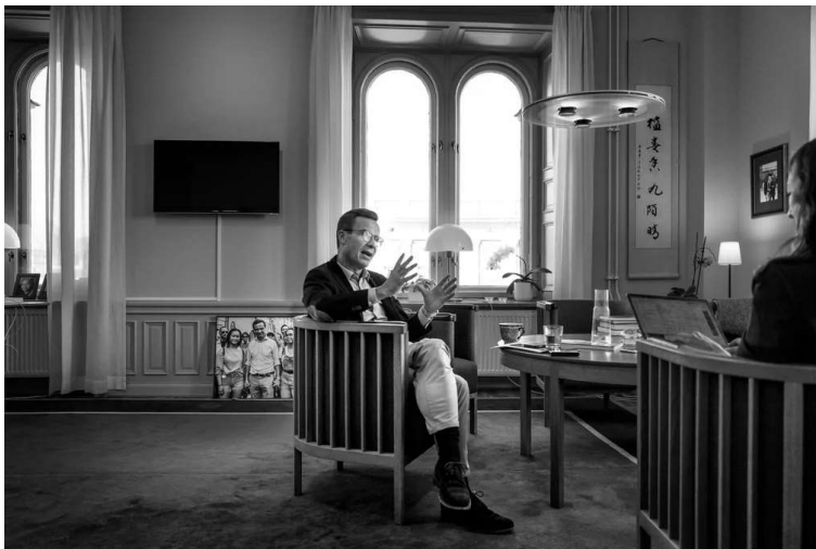
M-ledaren Ulf Kristerssons arbetsrum i riksdagen.

– Nej, men polisen har ganska bra koll på vilka som är med i eller samverkar med gängen.