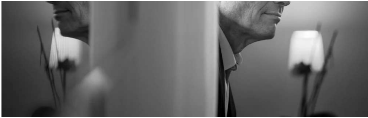
Ulf Kristersson

M-ledaren lovar att göra allt han kan för att få en borgerlig regering på plats, trots den parlamentariska situationen.