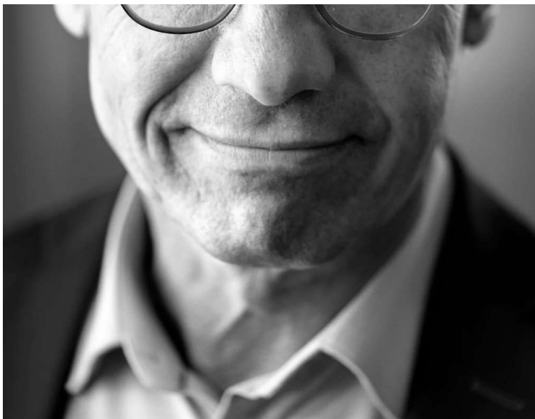
M-ledaren lovar att göra allt han kan för att få en borgerlig regering på plats, trots den parlamentariska situationen.

Kristersson öppnade i Expressen i juni för att budgetsamarbeta med Sverigedemokraterna, trots sina tidigare löften om motsatsen.