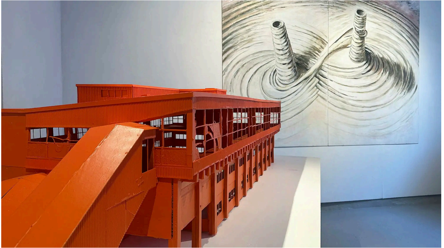
Vy från galleriet Tegen 2 med skulptur av Jakob Krajcik och målning av Maria Backman.

På Södergallerierna Tegen2 och Studio 44 visas en utställning som tar sig an ödesfrågan om nya hemvister för jordens alla flyktingar. Här finns en rad starka och satiriska videoverk, skriver Birgitta Rubin.