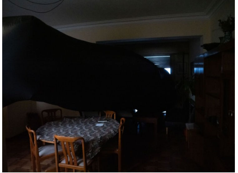
Paula Urbano Oscillating Absence 2011, 10 m x 1.8 m diametro en la base, nylon, taffeta, mecanismo para inflarlo.