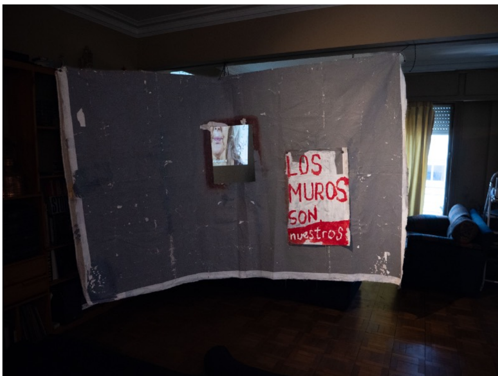
Juan-Pedro Fabra Guemberena, Muros 2022, 250x350 cm, oleo, acrilico sobre lienzo.