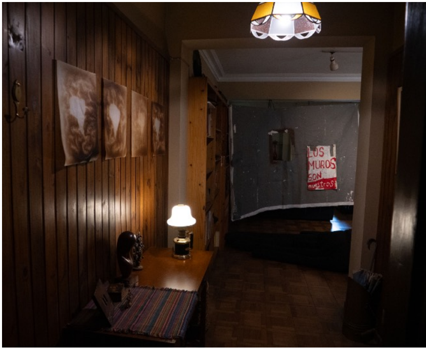
Runo Lagomarsino 2023, 36x42cm (cada uno), papel de cocina.