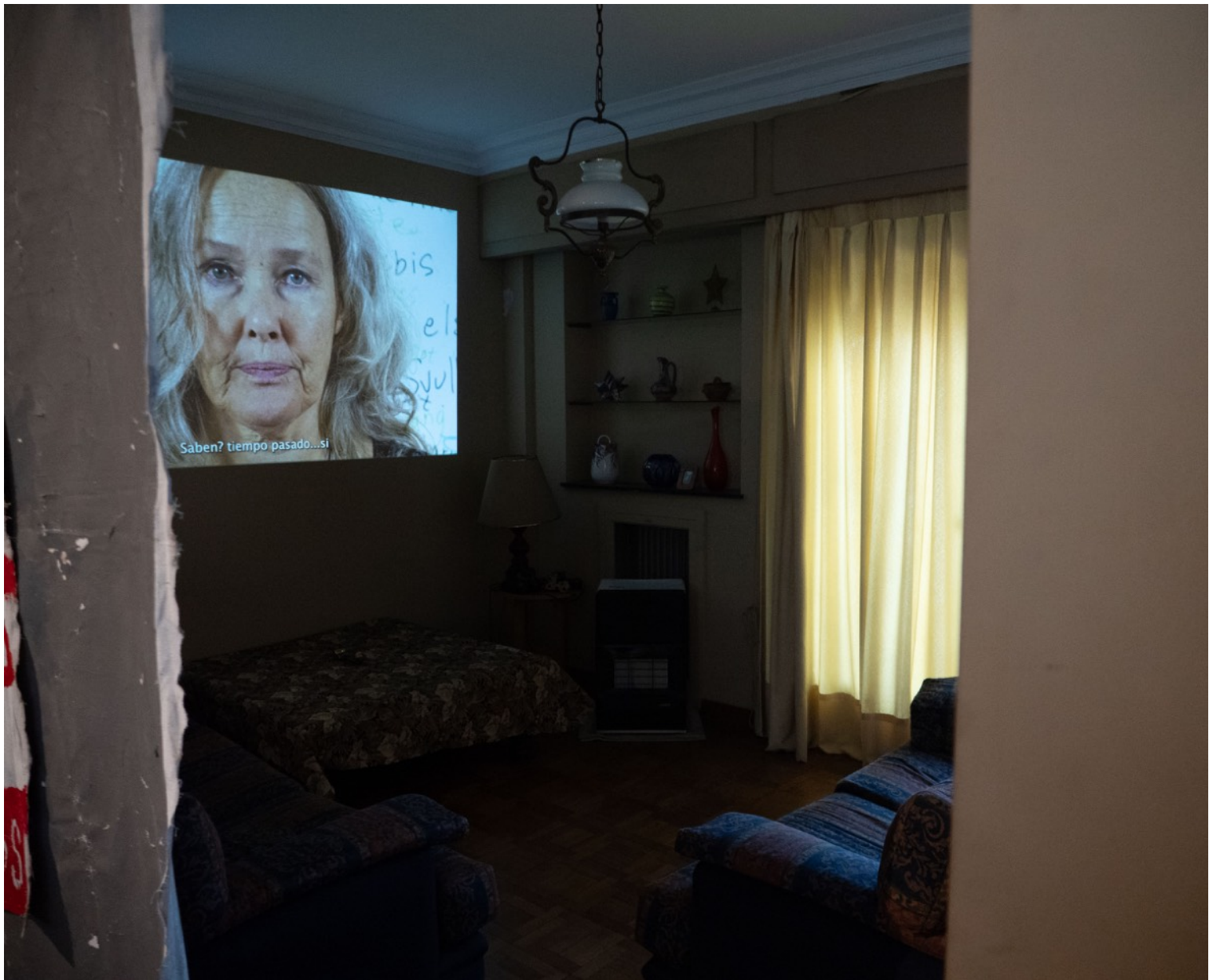
Julia Peirone Pizarrón de Adriana 2023, video 11.14 min