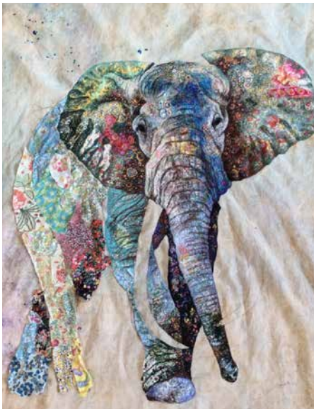
Hovedet og en del af forbenet er frihåndsquiltet.