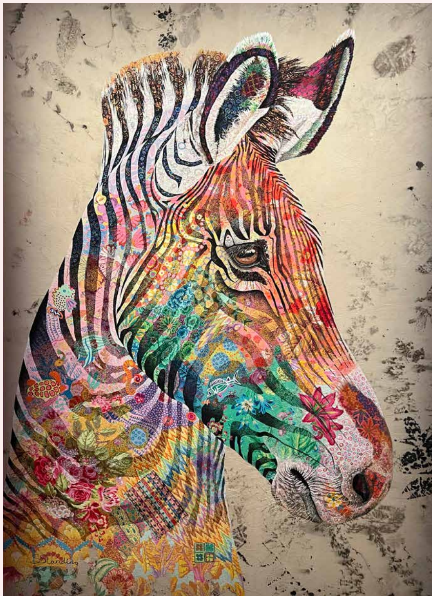
Zebra – et af de nyere værker.