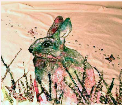
Kanin fra 2009.