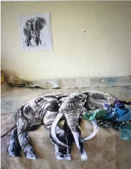
Grundskitse på væggen og liggende en udskåret skitse i korrekt størrelse.