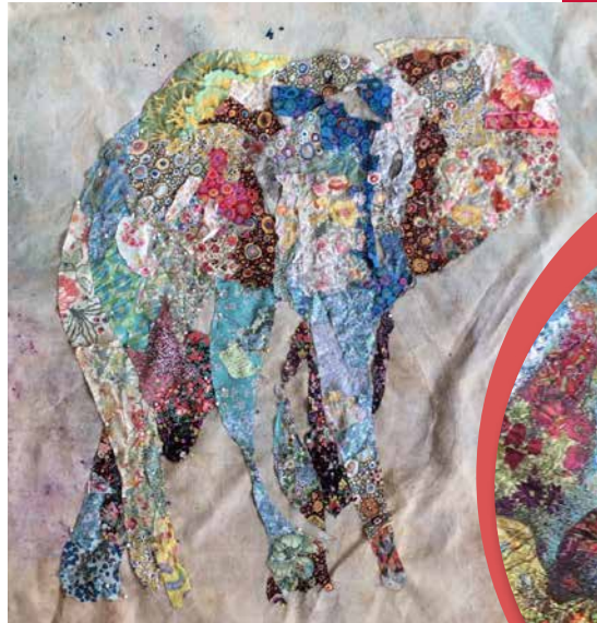
Farvet canvas og udlagte stykker stof – øjne er syet.