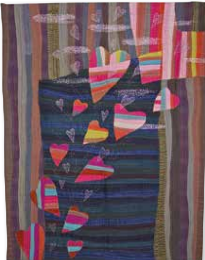
"Heart Series 4", 1997.

kendt og kom på udstillinger rundt om i verden og vandt priser. De første quilte var ofte applikationer med selvportrætter. Så kom serier med log cabin-quilte og med hjerter i mange variationer og stærke farver, oftest skåret "free style" uden brug af linealer.