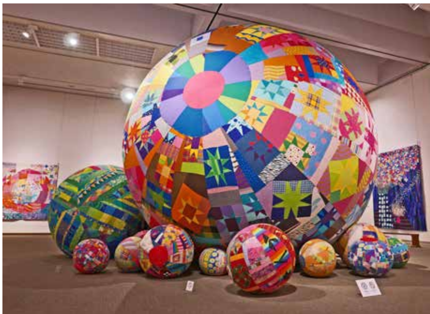
Festligt indslag på en quiltudstilling.