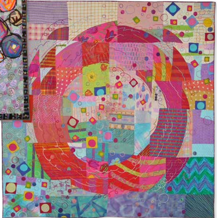
"A hope for peace in the heart 1", 1999.