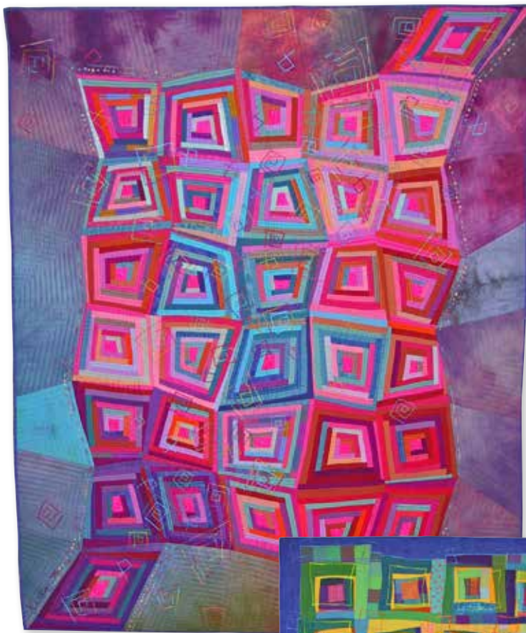
"Warped Log Cabin", 1994.