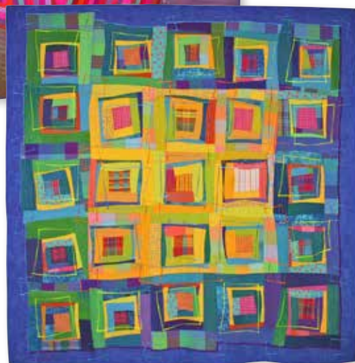
"Log Cabin in Wonderland", 1997.