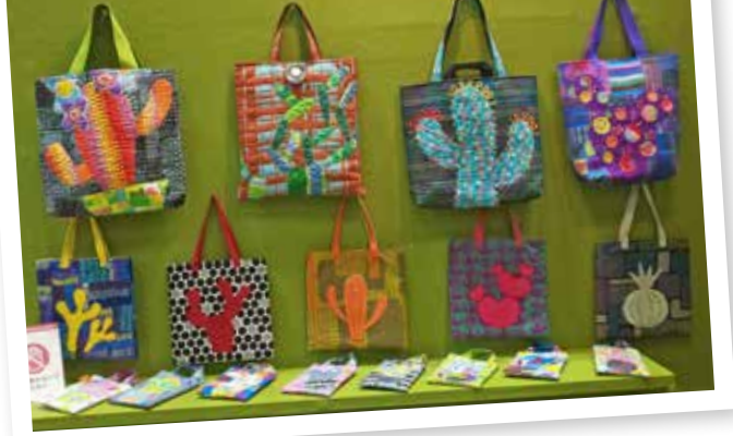
Tasker med kaktus.