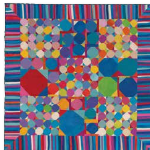
"Robbing Peter to Pay Paul 2", 2021.