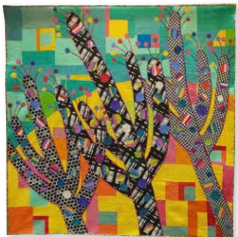
Ny quilt med kaktus, 2019.