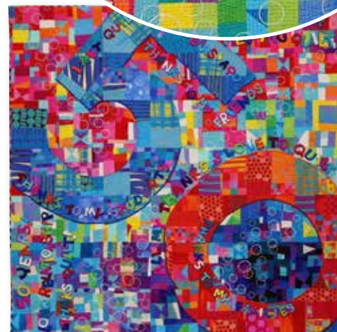
"50 Years with Quilts", 2020.