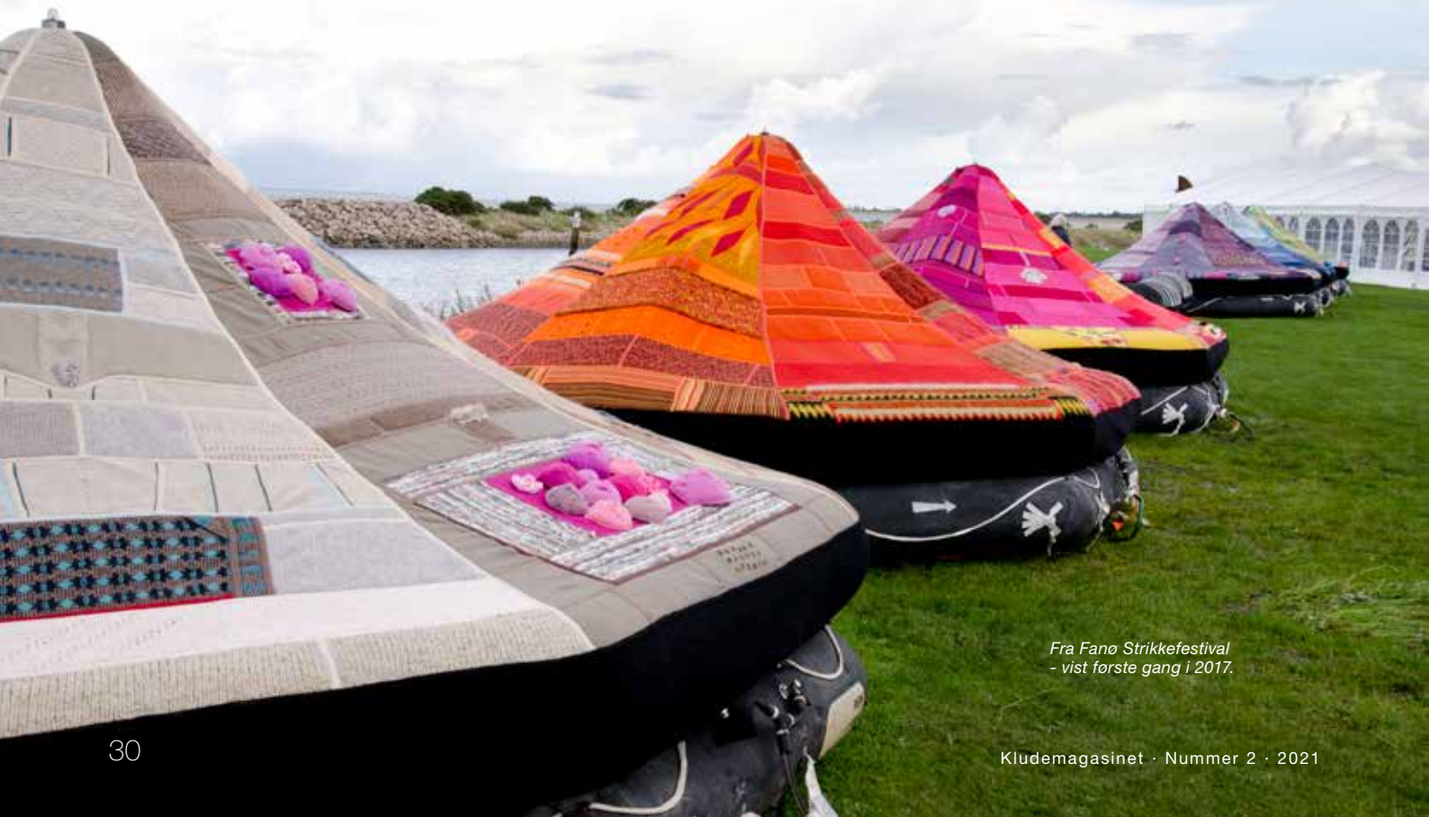
Fra Fano Strikkefestival - vist første gang i 2017.

De 150 kg indsamlet ufærdigt strik kunne dække et areal på ca. 300 m 2 , og så begyndte patchworkarbejdet.