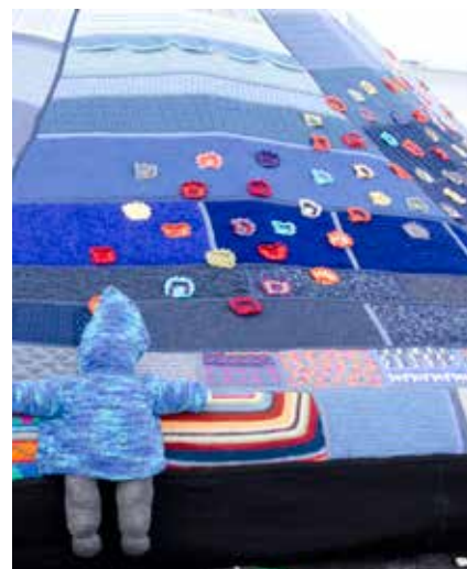
Fra udstillingen The Knitting & Stitching Festival i 2019.

Jeg sorterede først al strikken efter farve. Hver af de seks retningsflåder bestod af otte store trekanter, som jeg lavede en efter en - 48 i alt. Jeg brugte kasserede faldskærme som understof, hvorpå jeg zig-zagede brutalt klippede firkanter af strik. Siden blev alle klippekanten dækket med i alt 3 km hestetømme/icord, strikket på en lille håndmaskine fra Prym tilsat Lego-motor og til slut syet sammen otte trekanter pr. flåde.