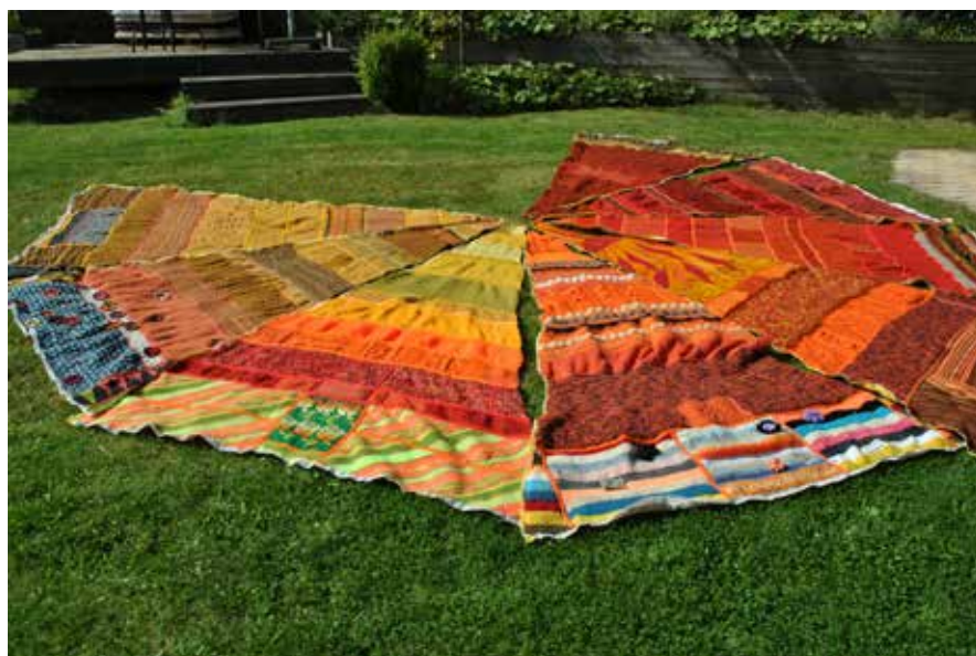
Kasserede faldskærme danner grundlaget for hver trekant, hvorpå der så er syet firkanter af strik.

Min baggrund for at kaste mig ud i sådan et projekt er bl.a. min uddannelse som teaterskrædder. Jeg er uddannet dameskrædder på Det Kongelige Teater, læste siden videre på skolen, der tidligere hed TEKO i Herning. Den uddannelse førte mig til et job i Cairo, hvor jeg var ansat på en strikkefabrik som kvalitetskontrollør for det danske firma Micha. I øjeblikket er jeg i gang med et nyt crowd-knitting projekt. "10.000 skygger" hedder det. Her strikker vi små "kugler" af vores bomuldsgarnsrester, som jeg siden samler til en ny storslået kunstinstitution.