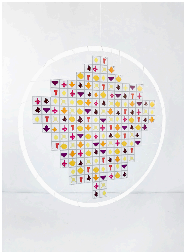
Skitse af en enkel cirkel, der består af 162 individuelle blade.