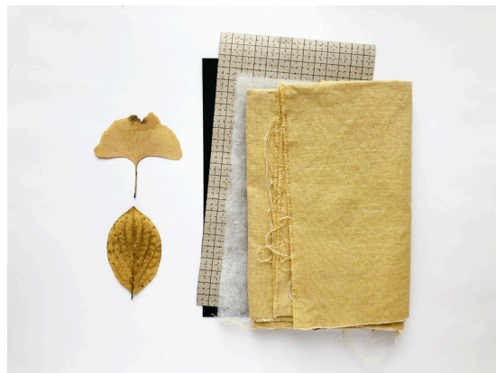
Eksempel på stof, der matcher bladenes farver

Disse og flere billeder kan downloades her: