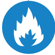
Panasonic EBL 512 Fire System