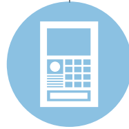
3rd Party Intercom System