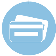
3rd Party Access Control System