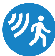
PACOM Alarm System