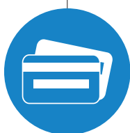
PACOM Access Control System