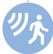
3rd Party Alarm System