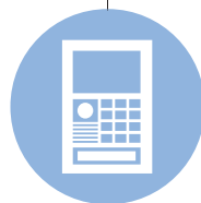
3rd Party Intercom System