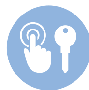
3rd Party Keys and Assets