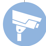
3rd Party Video System