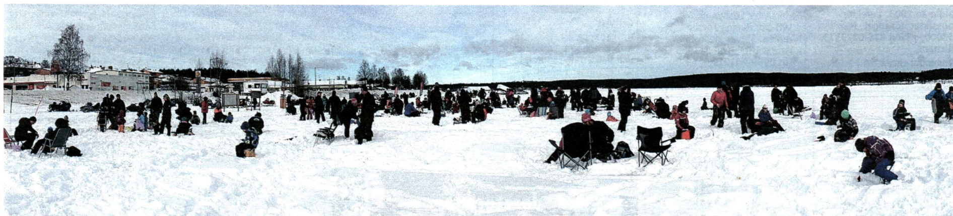
Lyckselenappet har en egen plats för barnklassen. Här ses ett välfyllt barnområde anno 2017.

Uppgift i Lyckselenappet: ”Jag hjälper till med anmälan och invägningen efteråt, samtidigt som jag ska försöka få till några bra bilder och sedan få iväg referat till media efteråt”