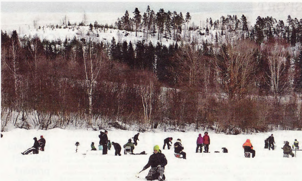
Vinterns tre pimpelfisketävlingar under det gemensamma namnet "Storfiskar'n i Örträskbygden" avrundades i lördags. Det här var 13:e vintern på raken som detta genomfördes i Långsele, Vargträsk och med finalen i Örträsk.