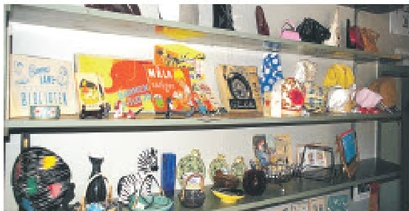
Wäskar, hammössor, häckor och mycket annat presenterades i mängd.