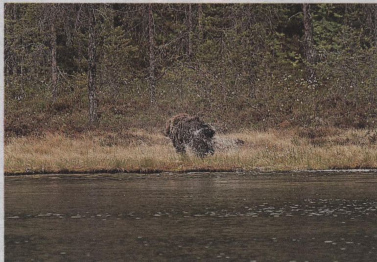
RUSKAR. Efter badet ruskar björnen av sig vattnet på strandkanten av Vargåhedtjärn.