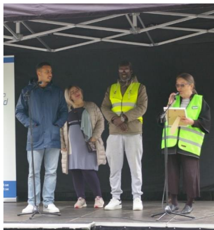
Årets förening 2021: Gemensam Förening

Gemensam Förening är en förening som i första hand har barn- och ungdomsverksamhet i Vivalla. Till skillnad från andra idéburna föreningar vänder de sig inte till en viss nationalitet utan deras aktiviteter vänder sig till alla. "Vi gör det helt enkelt möjligt för barn och ungdomar att ha roligt. Vi gör ingen skillnad på folk utifrån deras bakgrund eller religionstillhörighet. Hos oss är alla välkomna!"