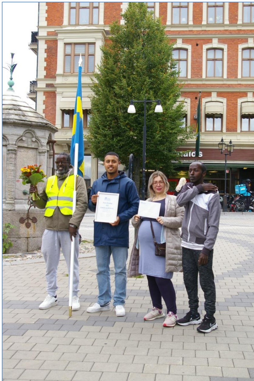
Årets förening 2021 Gemensam förening