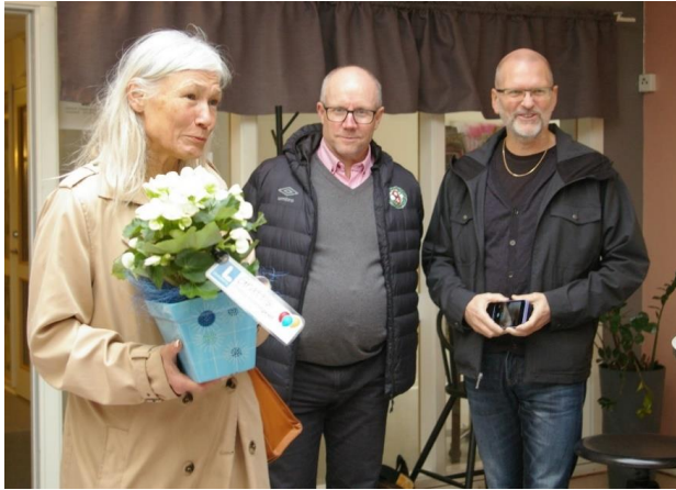
Representanter från Liberalerna uppvaktar

Fredag den 8 oktober firande föreningsrådet 80 år. Det gjordes med Öppet hus på eftermiddagen samt middag för styrelse och anställda på Restaurang Svampen.