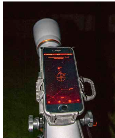
En app viser i dette tilfælde, i hvilken retning man kan se Mars

Det er bedst at studere detaljer på Månen, når den er 85 procent fuld