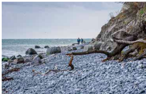
Det er et must at komme ned til vandet for at se klinterne nedefra. Vil man vandre på stenstranden, kræver det godt fodtøj