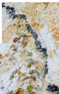
I kridtet ses tydelige lag af flintesten. Man kan også finde fossiler

Har du mere tid, så tag bilen mod nord til p-pladsen ved Jydelejet. Gå den lille kilometer i den afrundede dal forbi græssende kreaturer til klinten, der her er endnu mere spektakulær. Det er nærmest, som om man befinder sig i et andet land eller en anden verdensdel med større naturparker. Det skal naturligvis foreviges med mobilen, der næsten må have tænkt noget af det samme. I hvert fald er der kommet en SMS, hvor der står „Velkommen til Sverige“.