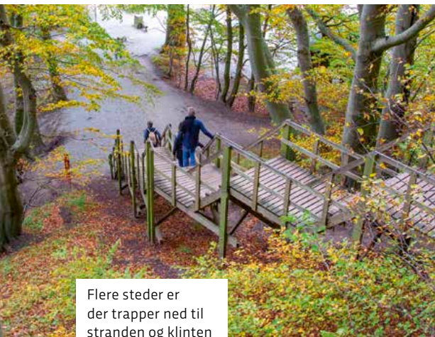
Flere steder er der trapper ned til stranden og klinten