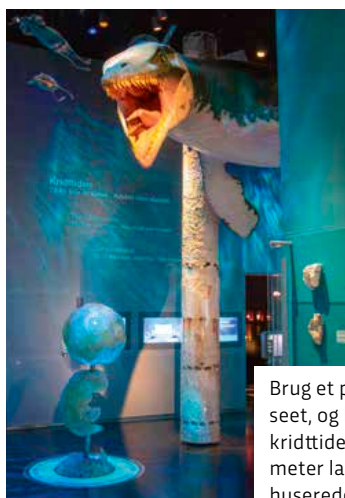
Brug et par timer på museet, og bliv klogere på kridttiden, hvor denne 15 meter lange mosasaur huserede i havet

Men så langt behøver man ikke at tage for at få verdensklasse natur.