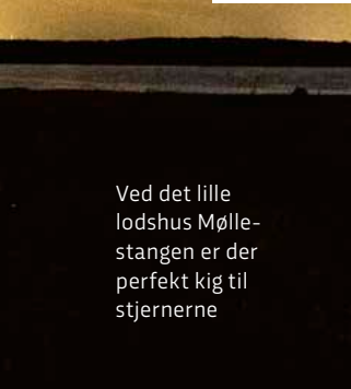
Ved det lille lodshus Mølle- stangen er der perfekt kig til stjernerne