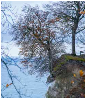
Der sker skred fra klinten hele året, så træerne lever på lånt tid. Al færdsel på området er derfor på eget ansvar