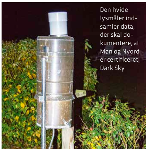
Den hvide lysmåler ind- samlere data, der skal do- kumentere, at Møn og Nyord er certificeret Dark Sky