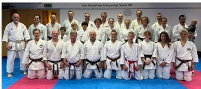
Gruppefoto efter et weekendseminar

Odder Karate er medlem af stilartsforbundet HDKI International og vi er Hombu Dojo (= hoved-dojo) for HDKI i Danmark ( HDKI Denmark ).