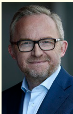
Mandag 29. august kl. 19.30 fortæller Jesper Theilgaard om "Klimaforandringer". Hvad der sker med vejret både her i Danmark og i udlandet.