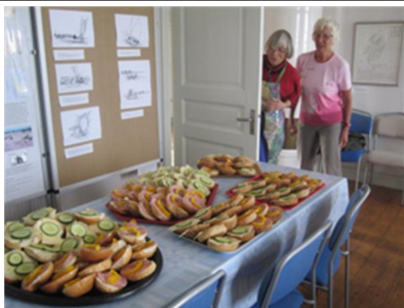
Öns damer i köket.