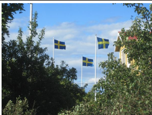
Flaggan i topp för släkten.