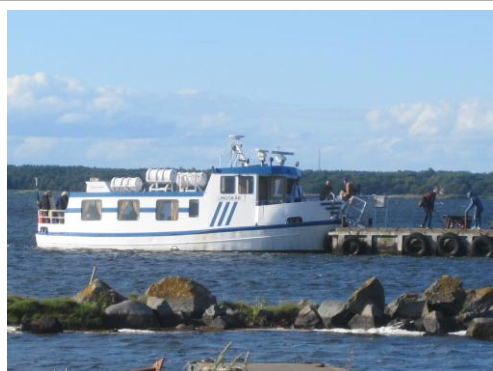
M/F Ungskär väntar på släktens medlemmar för avfärd.

Med lärarinnor, ofta unga sådana som fann sin lots på Långören, blev fru och lämnade plats åt en ny ung lärarinna osv. Så funderar vi över hur detta har påverkat livet på vår lilla ö. Lotsen som fick resa runt i världen för att få en ordentlig ”seglation” som man kalla den erfarenhet som han behöver och sedan hamnar på sjöbefälsskolan för teoretisk utbildning, möter en lärarinna med boklig kunskap och intresse. De slår sig ner på en liten ö och lever på stranden. Visst måste detta ha satt sina spår? Ja kanske det, samtalet går och så till sist så närmar sig dagen sitt slut och vi samlas i Missionshuset för den sista programpunkten för denna gång.