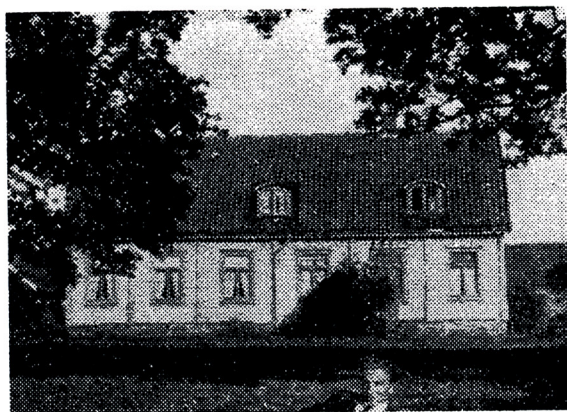
Skällenäs gård. Foto omkring 1930.