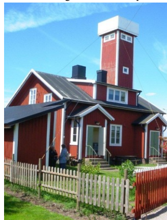
Lotsstationen på Långören.

han med lustiga händelser i sammanhanget, vilket bidrog till många muntra skratt. Man passerade "God natt" och "God morgon" med sina speciella historier. Tjurkös historia med sin stenhuggeriverksamhet, som bidragit till många av Tysklands motorvägar inför andra världskriget, fick man veta om, när båten strök förbi utskeppningshamnen. Den rökta laxen till lunchen från Sturkös Rökeri togs ombord vid hamnen i Sanda.