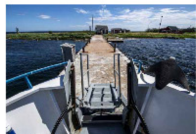
Skärgårdstrafiken går mer regelbundna turer under sommarhalvåret jämfört med under vintern.

"Jag är en av de tre äldsta som minns öns historier. För mig är det hemma att bo här. Ön är en tidskapsel."