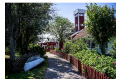
En grusväg sträcker sig genom det bebyggda området till en grind, kallad lag och rätt-grinden. Den särskiljer boskap.