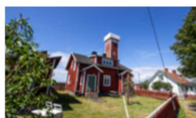
Lotshuset är sedan 1996 ett byggnadsminne. Trappan upp till tornet är nedtrampad av öns tidigare lotsar.

– När historikerna infirån fönstret blev intressanta sa pappa till mig "Gå och