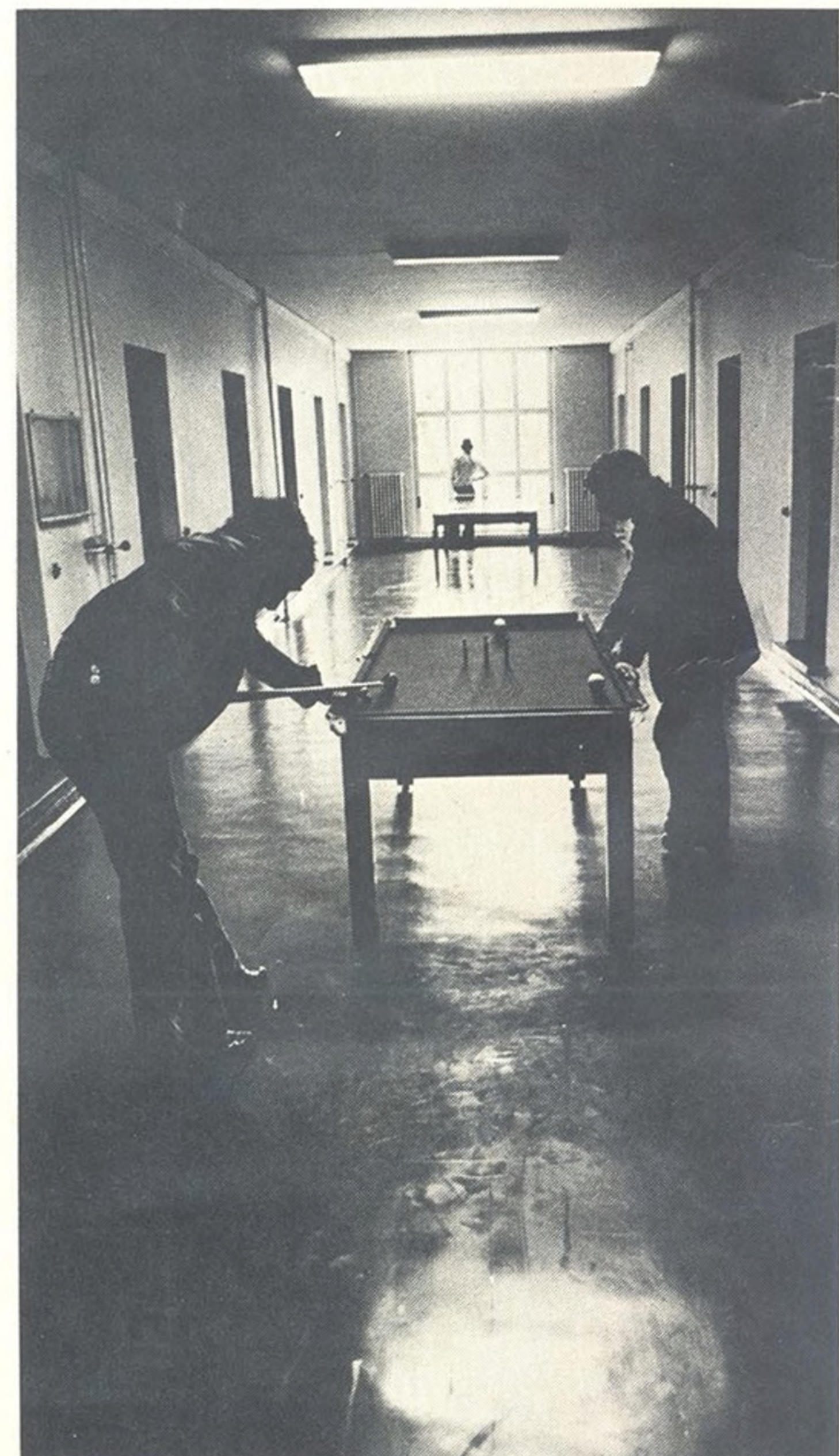
Nok er de enkelte værelser små, men gangarealet er til gengæld rigeligt til både billard og bordtennis.