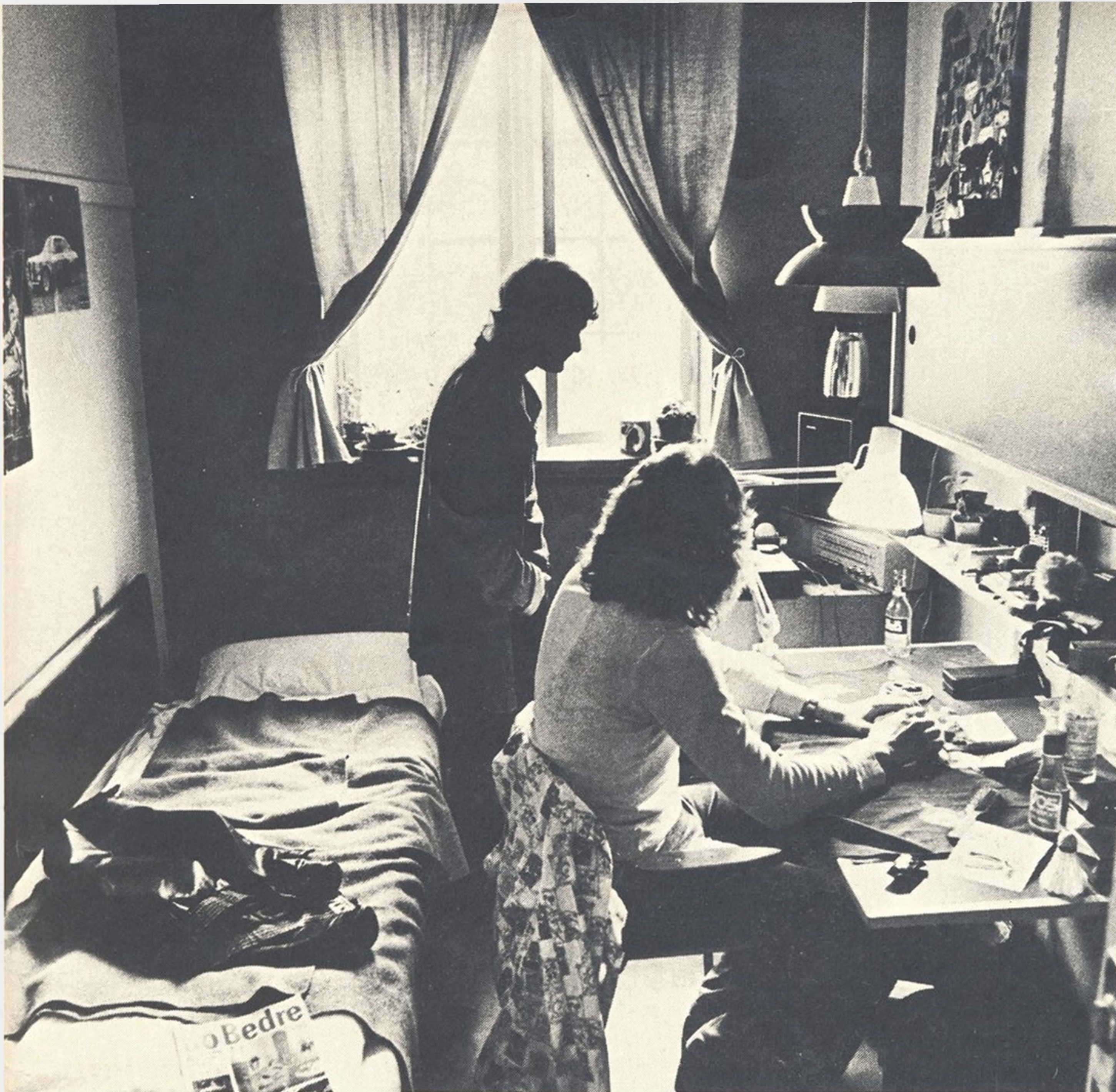
Fangerne har deres eget værelse og nøgle så de kan læse efter sig.

gens skyld, forklarer han. Og når det går godt de første par gange, så bliver de fleste ved, indtil de bliver taget en dag.