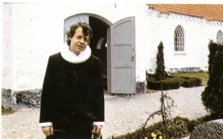
Familien forstod ham ikke, da han valgte at blive landsbypræst på Fyn

Nu sidder folk foran hjemme-alterets flimrende underholdningstilbud, der giver dem alting og ingenting og gør dem rastløse,« skriver præsten. »Det var H. C. Andersen også, men dengang kunne han sige: »I Danmark er jeg født, der har jeg hjemme, der