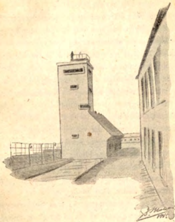
Betontaarn i Neuengamme. Hegnet, der støder op til det, er forsynet med Højspænding.