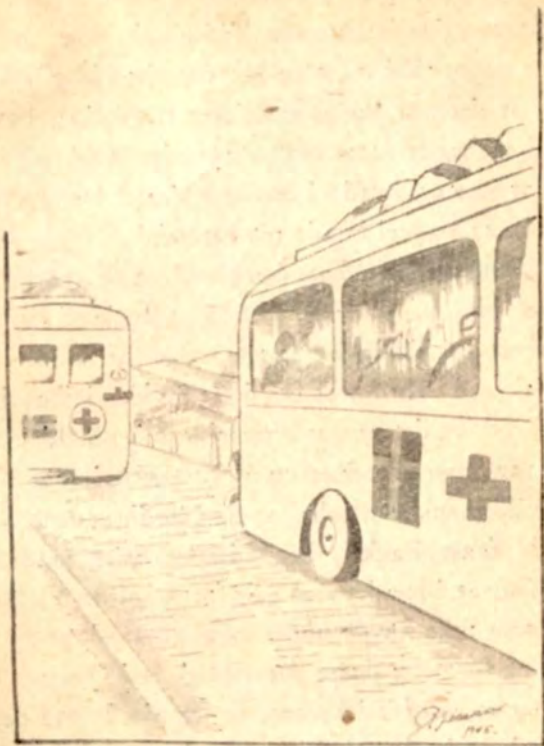
Med svensk Røde Kors gennem Sydtyskland — til et nyt Helvede i Neuengamme.