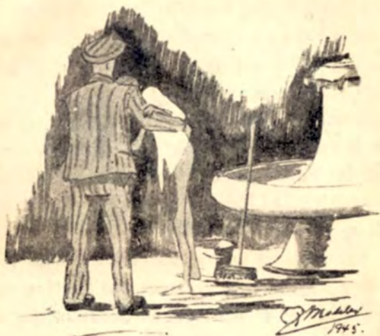
En Patient skal vaskes i Dachau.

og indtørrede, fordi de syge havde ligget paa dem, har jeg kunnet spise dem med god Appetit. Endog-saa smaa Stumper Brød, der var faldet ned mellem Sengene fra disse syge, har jeg samlet op og ædt i Smug.