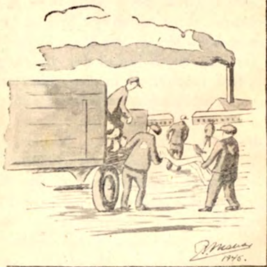
Kadavere læses i Dachau for at føres til Krematoriet.