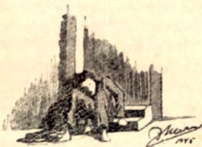
Udmattet af Sult og Søvnløshed i Dachau.

ne sig til Patienternes febrile Tilstand ved at føle Pulsen, men tælle den kunde han ikke, da vi ikke havde hverken Pulstæller eller Lommeur.