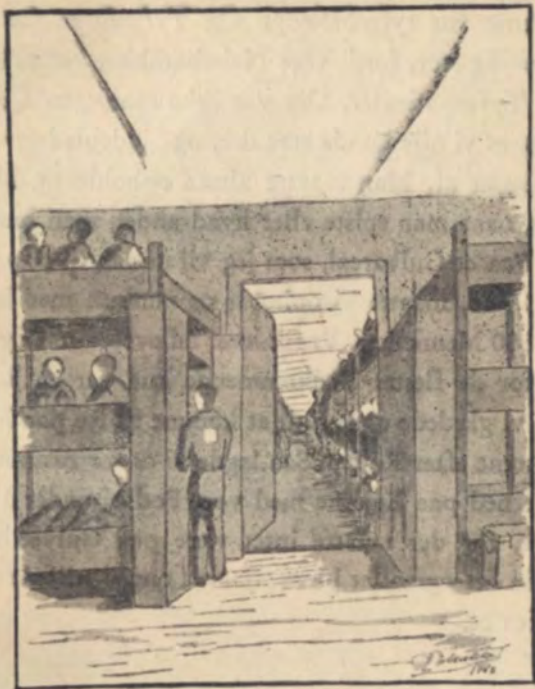
Et Kig ind i Dachaulejrens Sovesal i en Barak. Dette Rum kunde huse mellem 3 og 4 Hundrede Fanger.