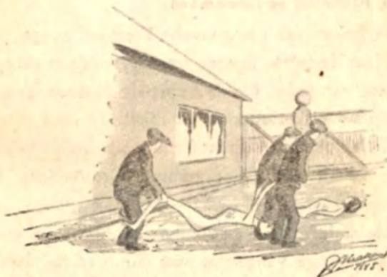
De døde bringes ud af Barakken i Dachau.

I den Tid, vi var i Lejren, døde der paa Sygehuset 15 Læger. Men det var kun en ringe Del af alle de døde. Man paastod, at der i hele Lejren døde 4—500 daglig i de værste Vintermaaneder af Lejrens 40.000 Fanger.