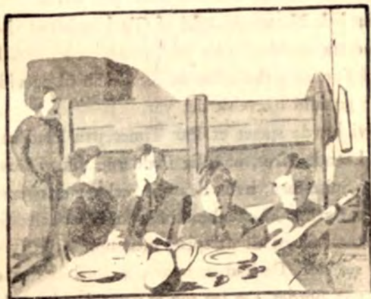
Fødselsdag i Frøslev. Instrumentet er lavet af en stor Køk-kenslev, der er forsynet med en udskåret Frø til Skruenhoved, altsaa en ægte "Frøslev".

Da jeg ingen Penge fik med hjemmefra, gav Stuekammeraterne mig 70 Kr., idet de sagde: „Da skal du ikke til Tyskland uden Penge“. Og jeg fik Tobak, Cigarer, Tændstikker, Sæbe, Barberblade, et Par Ruller Toilet-papir, alt sammen noget, de vidste havde Værdi i Tyskland. Ovre paa Sygehuset havde de vældig travlt med at pakke forskellige Præpara-