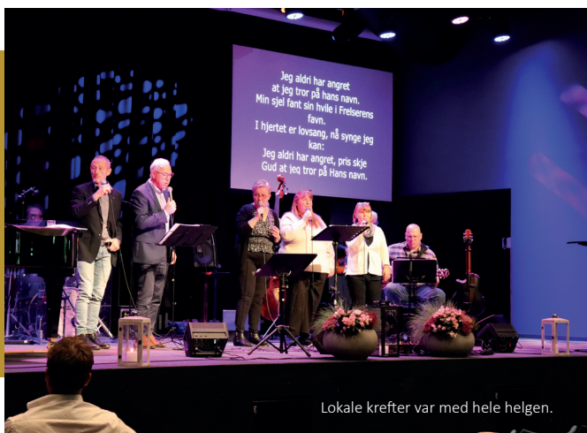
Lokale krefter var med hele helgen.