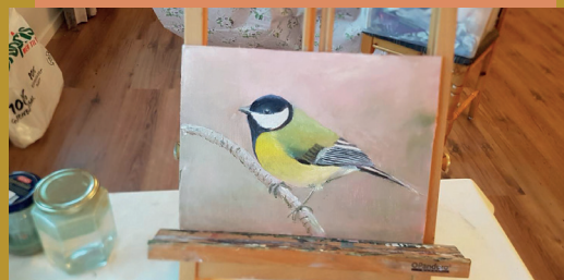
Tekst og foto: Reidun Åndal

En trofast flokk møter opp til dugnad på mandagene. Dagene har vært travle, men det var godt å komme i gang igjen. Vi er glade og takknemlige for at Frænabu blir brukt til ulike samlinger for barn, unge og voksne. Målet er at det skal være godt å komme og være på Frænabu.