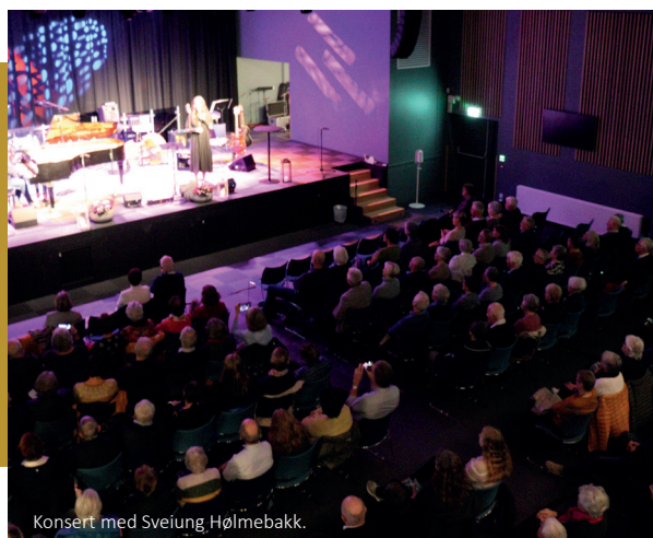
Konsert med Sveinung Hølmebakk.