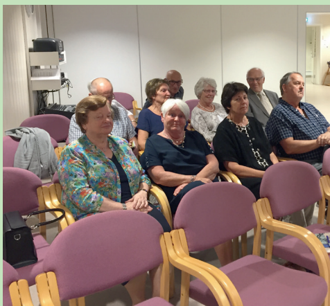
Fra samlingsfesten i Kristiansund.