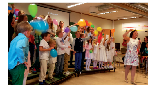
Liv og røre på sommerkonsert.