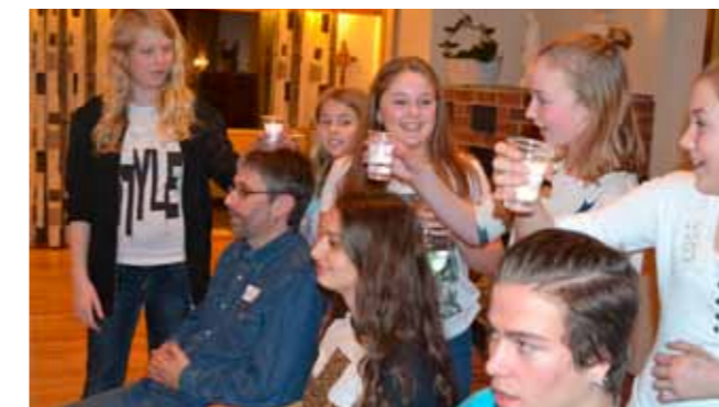
Jenter med skumle hensikter.

Nå er vi vel hjemme igjen etter en flott leir! Vi har hatt ei helg med mye blæst, men det ble