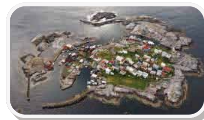
Grip - med blant annet Norges minste stavkirke