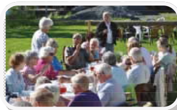
Rømmegrøt ute under tidligere Sommerdager

Årets turmål er GRIP, det fraflyttede fiskeværet på en bitteliten øy ytterst i havgapet uten for Kristiansund. Vi planlegger også flere kortere turer i nærområdet. Blant annet håper vi å få til en tur til Bergtatt, de store innsjøene inne i kalksteinsfjellet på Eide.