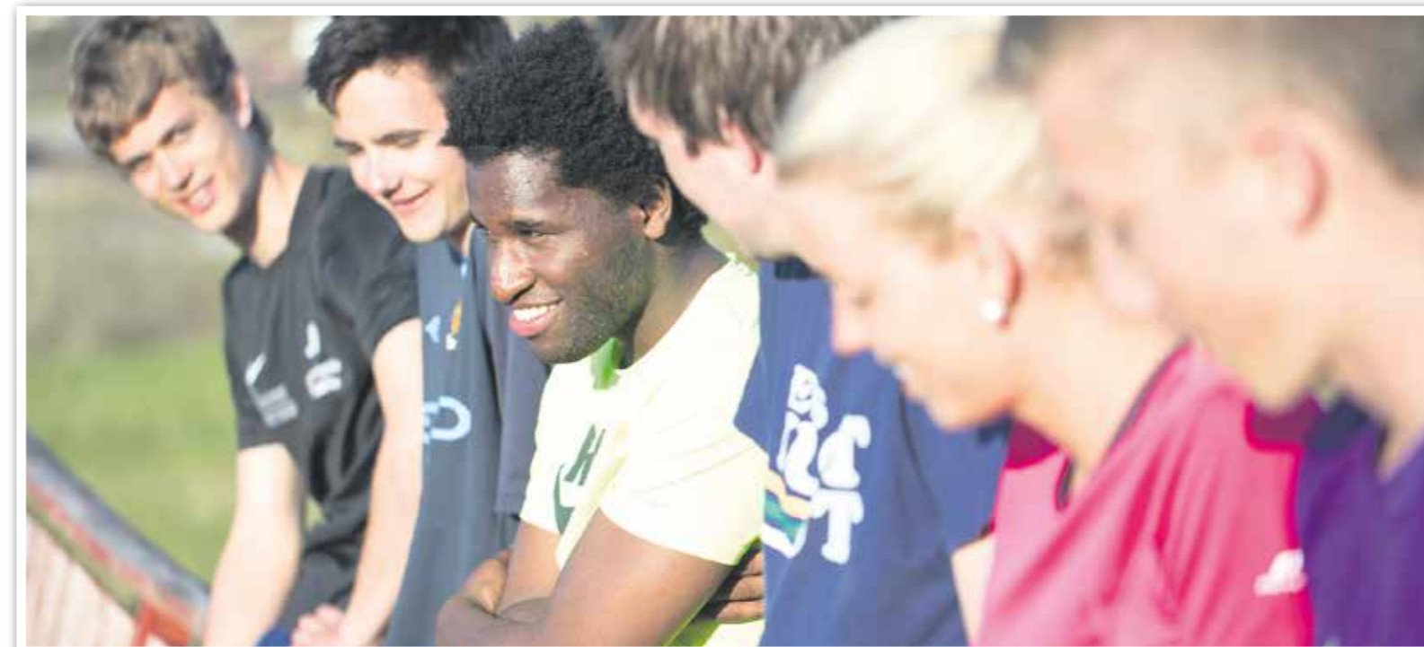
Forventningsfulle, nye elever på Høgtun Folkehøgskole.

I skrivende stund sitter jeg på Frænabu Misjonssenter, omgitt av latter og skral, kaffelukt og leirstemming. Det er andre uka på Høgtun.