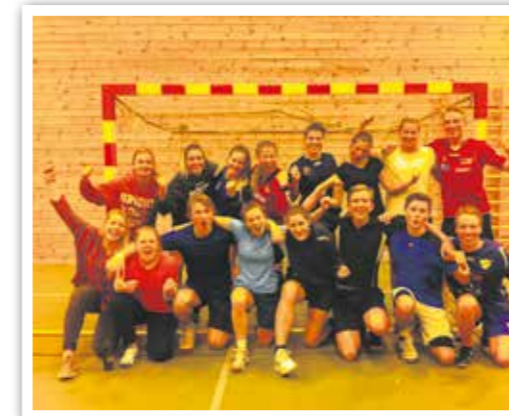
Fornøyde elever etter seier i håndballkamp.

Tekst: Rektor Helge Kjöll