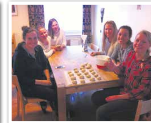
Kjekt å lage fasterlavensboller.