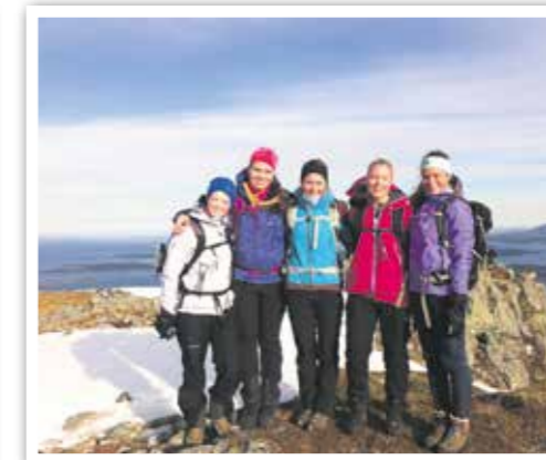
En fornøyd gjeng på toppen av Ræstadhornet.