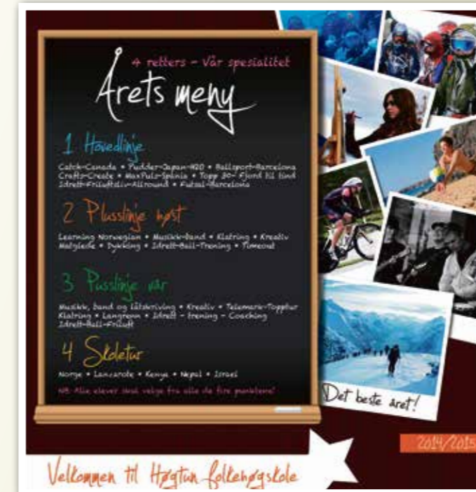
Høgtun Folkehøgskole har et godt og variert tilbud.