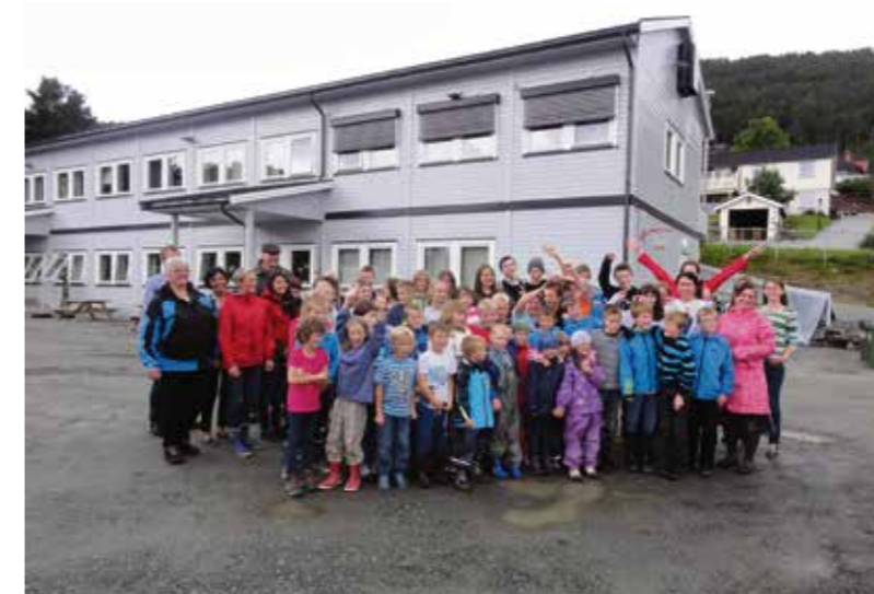
Alle lærere og elever ved Molde Friskole fotografert på første skoledag i august 2013

TEKST: JEANETTE VESETVIK