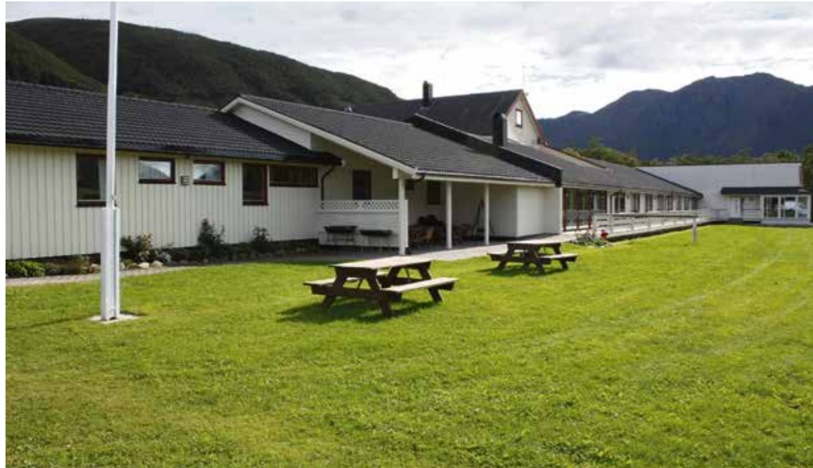
Frænabu Kurs- og misjonssenter, 6444 Farstad.

Nå har det gått 10 år siden kretsstyret hadde møtehelg på Oppdal der de fattet vedtak om å foreslå for årsmøtet å kjøpe Frænabu.